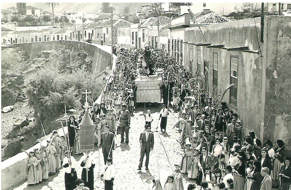
El nuevo paso del Domingo de Ramos procesionó por primera vez el 14 de abril de 1957.