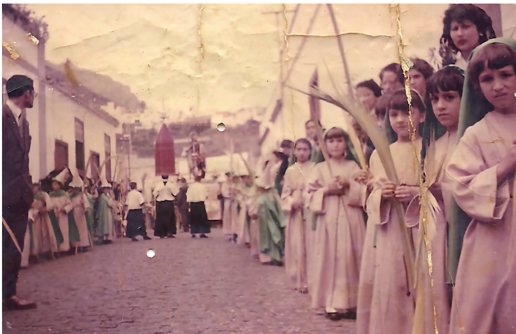
Cofradía infantil creada para acompañar al nuevo paso de la Entrada Triunfal de Jesús en Jerusalén (c. 1957).