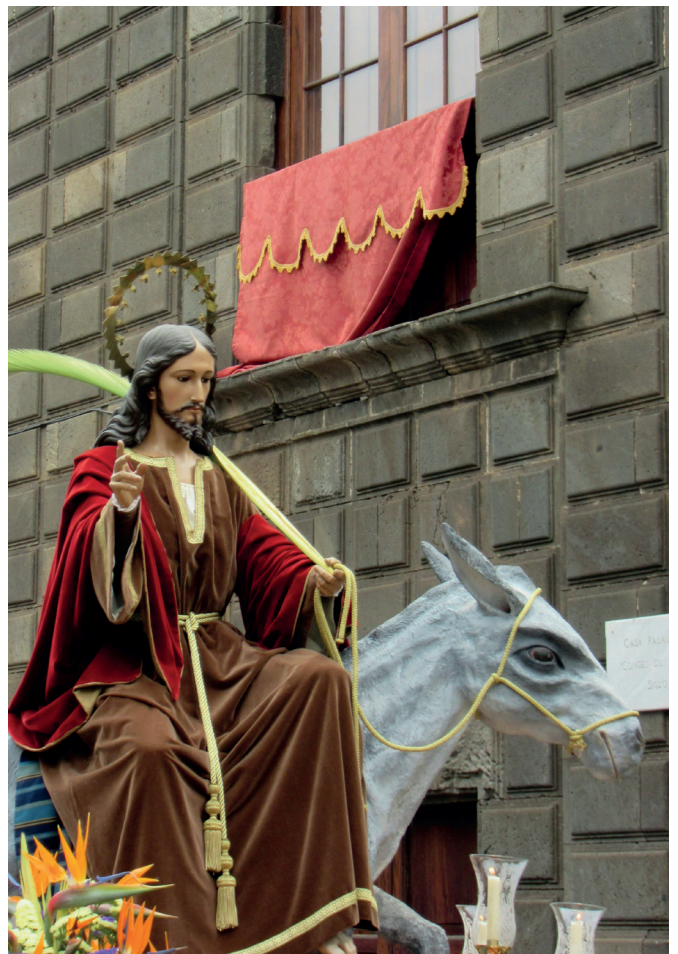
Ayer y hoy de una imagen de fe (c. 1957 y 2015).