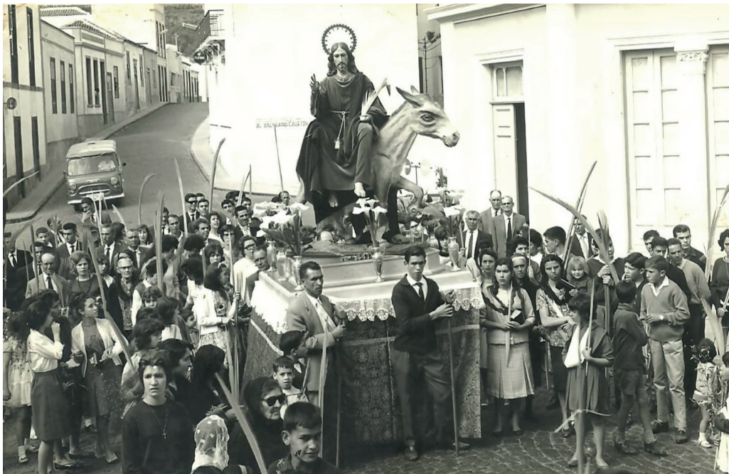
Domingo de Ramos de 1965 (11 de abril).

tancia, por ejemplo, de un gasto de 441'70 pesetas por la compra de todo lo necesario para la confección del estandarte de dicha congregación y otros artículos para el propio paso.